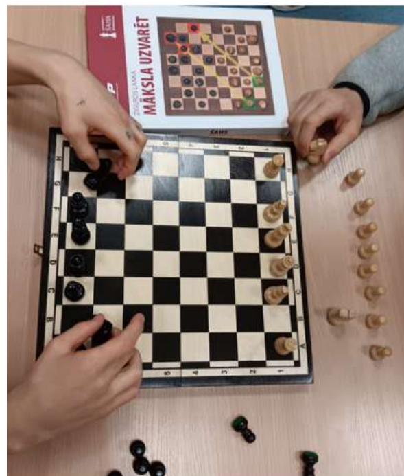
Jugadores preparando piezas durante los talleres

La FIDE tiene actualmente su sede en Lausana, pero se fundó inicialmente en 1924 en París bajo el lema «Gens una Sumus» (en latín, «Somos una sola familia»). Fue una de las primeras federaciones deportivas internacionales, junto con los organismos rectores del fútbol, el críquet, la natación y el automovilismo.