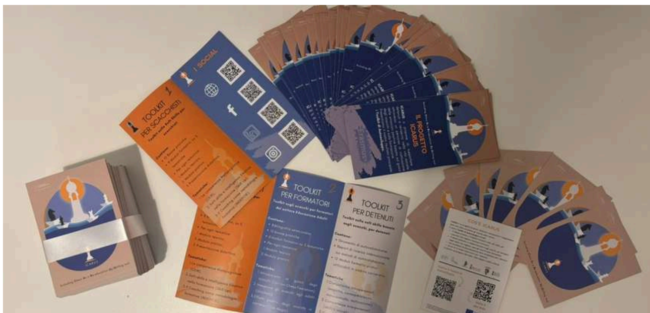
Materiales de difusión utilizados en los talleres implementados en Italia

Un componente fundamental en el diseño del curso es la progresión secuencial de los temas. El currículo debe comenzar con las reglas básicas del ajedrez, incluyendo los movimientos de las piezas, las condiciones de victoria y los principios estratégicos elementales. Este enfoque progresivo garantiza que cada participante adquiera una sólida comprensión de los fundamentos del juego, lo que le servirá de trampolín para profundizar en estrategias más complejas. Además de la instrucción técnica de ajedrez, el curso debe incorporar actividades destinadas a desarrollar habilidades cognitivas transferibles. Por ejemplo, el ajedrez fortalece inherentemente el pensamiento crítico y la capacidad de resolución de problemas.