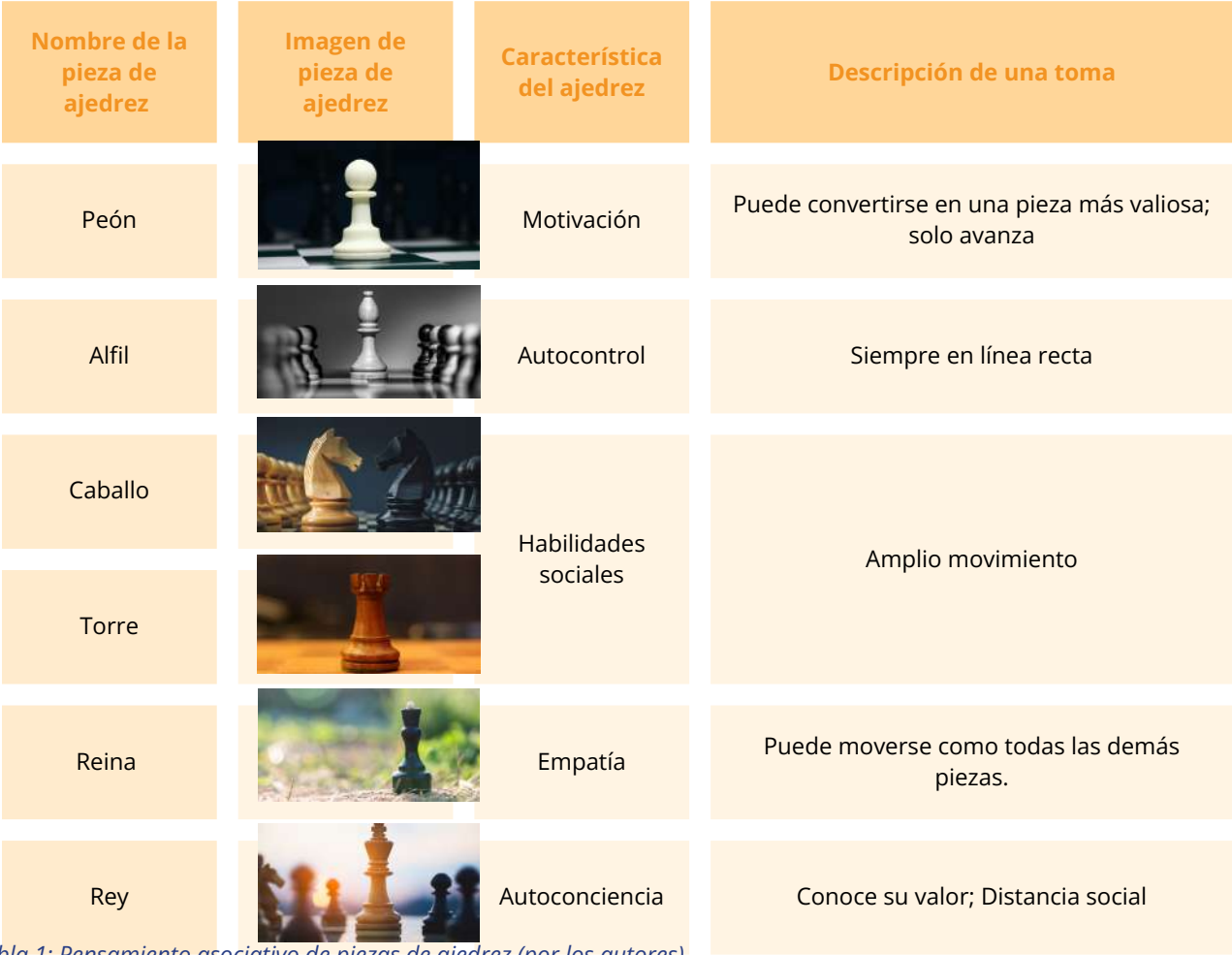
Tabla 1: Pensamiento asociativo de piezas de ajedrez (por los autores)

La torre se caracteriza por poder moverse a cualquier casilla de la columna o fila en la que se encuentra. En otras palabras, la torre se mueve en línea recta, horizontal y verticalmente, una o más casillas a la vez, a menos que otra pieza se interponga en su camino. Una torre no puede saltar sobre otra figura. Si una pieza del oponente se interpone en su camino, la torre puede capturarla permaneciendo en su lugar. La torre se asocia con el autocontrol, como lo señalaron los entrenadores de ICARUS en la sesión de entrenamiento realizada en junio de 2024, como se muestra en la Tabla 3.