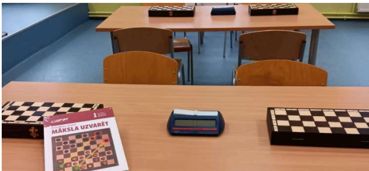
Sala de entrenamiento y tableros de ajedrez, así como reloj de ajedrez.

Un ajedrecista adquiere el hábito de pensar a nivel micro y macro: ¿qué jugaré hoy (apertura - dejar al oponente) y pensar al menos tres movimientos y por adelantado? Al pensar dos pasos por adelantado, por ejemplo, en la vida, ¡puedes evitar errores!